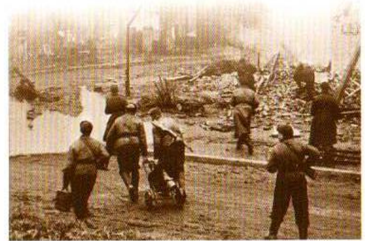
Уличные бои в Бреслау (Вроцлав), 1945 год

Дивизии, сформированные в начале войны в Красноярском крае, встретили Победу в разных уголках фронта. Последней боевой операцией 309-й Пирятинской Краснознаменной стрелковой дивизии стало освобождение города Брес-