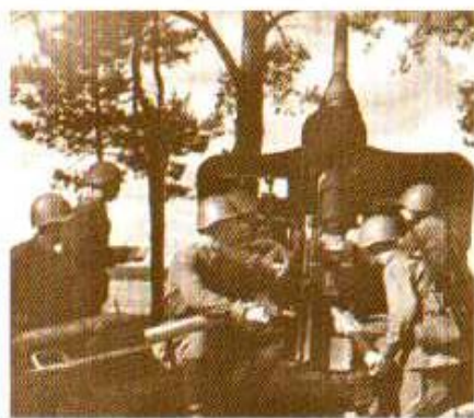
Артиллеристы ведут огонь по врагу.

Осенью 1942 года Ставка Верховного Главнокомандования готовила сразу два мощных контрнаступления — под Сталинградом (операция «Уран») и в районе Ржева (операция «Марс»). Операция «Марс», руководителем которой был генерал армии Г. К. Жуков, должна была