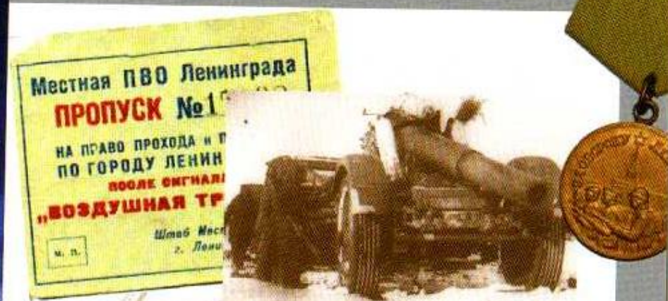
Военные трофеи – тяжелое орудие с тягачом.

шое число артиллерии – 180 орудий и минометов на каждый километр фронта. К 18 января передовые подразделения Ленинградского фронта пробили коридор у Ладожского озера шириной в 8-11 километров. За семнадцать суток по берегу были проложены автомобильная и железная (так называемая «Дорога победы») дороги. Окончательно блокада, продлившаяся 872 дня, была снята 27 января 1944 года.