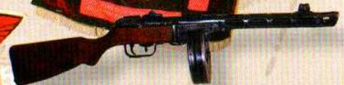
Пистолет-пулемет Шпагина образца 1941 года

Курская битва началась в ночь на 5 июля 1943 года, в 1 час 30 минут, артиллерийским ударом Красной Армии. В первые дни противник продвинулся вперед на десятки километров, однако уже к вечеру 9 июля наступление немецких дивизий было остановлено. Не добившись успеха на Обоянском направлении, враг