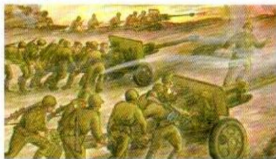
В бой вступила артиллерия. Рис. Б. Дрыжака

Смоленское сражение началось 10 июля 1941 года. К 5 августа немцы завершили ликвидацию Смоленского котла, пленив более 300 000 советских бойцов. Разгромить противника встречным наступлением не удалось, и к 10 сентября 1941 года Красная Армия прекратила попытки отбить город, потеряв в боях более 485 000