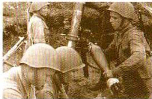
Сибирская дивизия готовится к бою

2 февраля является днем воинской славы России, днем победы советского народа в Сталинградской битве. Подготовка к сражению началась еще 12 июля 1942 года , когда был создан Сталинградский фронт, для защиты города и противостояния 6-й армии Паулюса. Первое столкновение 62-й и 64-й армии Сталинградского фронта с 6-й немецкой армией состоялось 17 июля на рубеже рек Чир и Цимла. Однако план немцев — стремительным ударом с ходу прорваться к Сталинграду — был сорван упорным сопротивлением советских войск. 13 сентября противник перешёл в наступление по всему фронту, пытаясь захватить