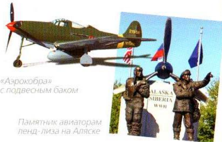
«Аэрокобра» с подвесным баком