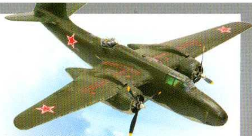
Самолет А-20 «Бостон»

войска 2-го Украинского фронта под командованием маршала Советского Союза И. С. Конева вышли на государственную границу СССР с Румынией — реку Прут. Уже к середине апреля Советская Армия освободила от фашистов всю восточную Румынию, продвинувшись