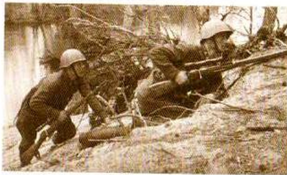
Советские снайперы занимают позицию.

12 января 1943 года, после новогоднего затишья, началась советская операция «Искра», главной задачей которой было снятие кольца блокады с Ленинграда. Со стороны Волховского фронта, которым командовал генерал армии К. А. Мерецков, врагу противо-