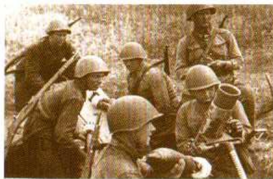
Минометный расчет на огневой позиции.

К началу 1944 года стало окончательно ясно: Германия проигрывает войну. Советский Союз, вопреки ожиданиям врагов и их союзников, выстоял. Его солдаты и командиры научились не только бить противника в обороне, но и наступать. 26 марта 1944 года