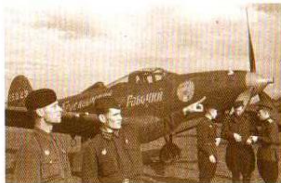
Передача самолетов «Азоробра» 21-у ГИАП

Гитлеровская операция по захвату столицы Советского Союза, начавшаяся 30 сентября 1941 года, называлась «Тайфун». Город предполагалось взять в течение первых месяцев войны, однако этим планам не суждено было сбыться.