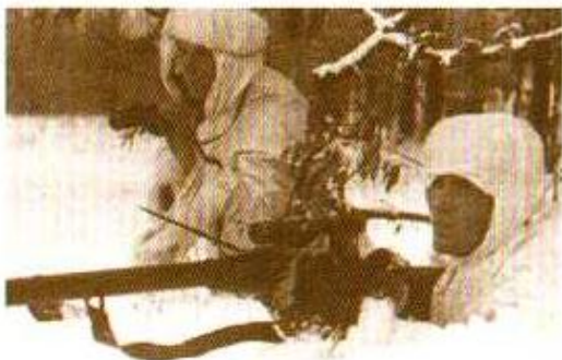
Снайперы Красной Армии на позиции

Наступление немцев на Кавказ началось 25 июля 1942 года. В планах Гитлера было уничтожение советского Черноморского флота, захват бакинской нефти и газа, создание плацдарма для дальнейших наступательных операций. На острие удара была поставлена элитная горнострелковая дивизия «Эдельвейс», сформированная из жителей горных районов южной Германии и Австрии.