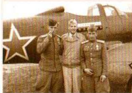
Американский и советские пилоты рядом с истребителем P-39 «Аэрокобра»

В Красноярске самолеты проходили технический осмотр, ремонтировались и передавались в 45-й запасной