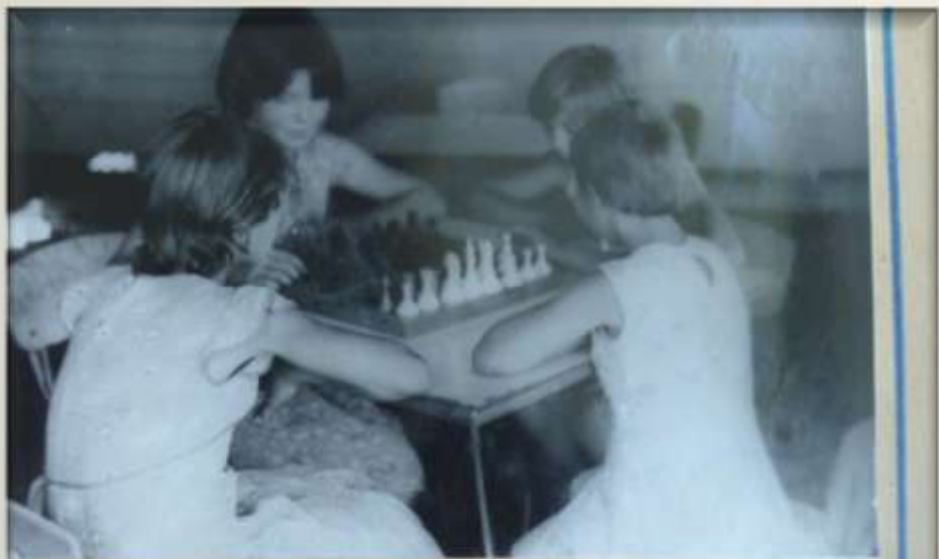
Во время отдыха, ребята живут в лагере интересной, насыщенной жизнью.