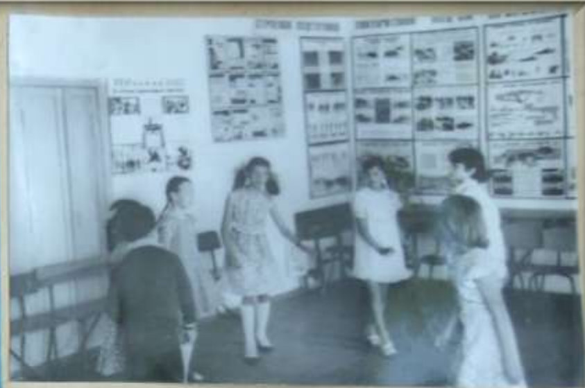
Каждый праздник пионеры приходят в Дом культуры, чтобы поздравить своих шефов.