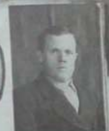
М. П. Садовский